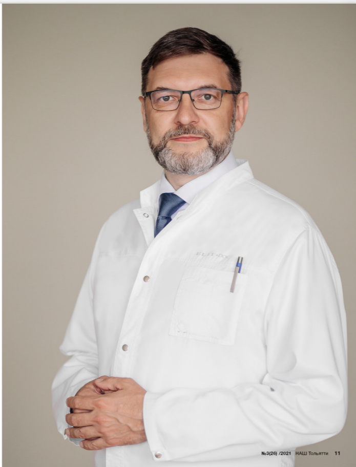
№3(26) /2021 НАШ ТОЛЬЯТТИ 11

Лыткин И.Ю. © 2021. 0205101 от 10.04.2020г.