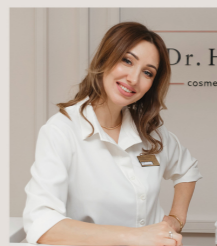
Dr. Hurtina cosmetology

Еще одно новое направление в клинике Dr.Hurtina, где есть новые безоперационные методики: